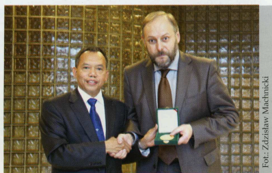
Przekazanie medalu Ambasady Indonezji w Polsce dla Wydziału Studiów Międzynarodowych i Politologicznych UŁ