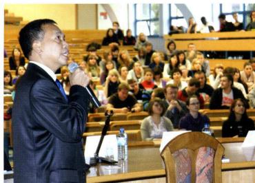
Ambasador Hazairin Pohan w trakcie wykładu

Efektom wizyty ambasadora Hazairina Pohana było wspólne przedyskutowanie planów rozwoju wzajemnej współpracy i zaplanowanie na rok 2010 jeszcze większego wydarzenia, ukazujące- >